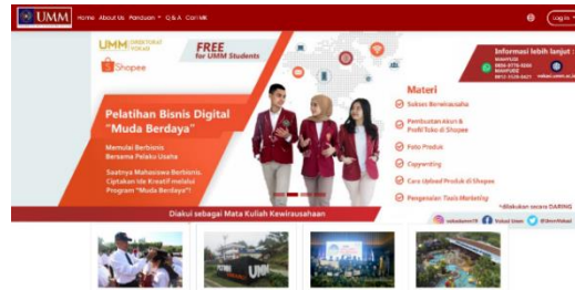
Gambar 6 Halaman route utama pada LMS