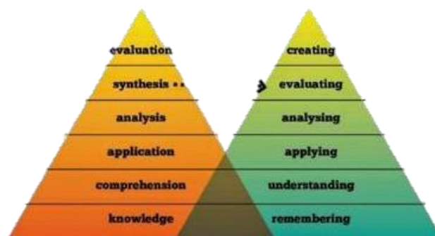
Gambar 2 Hierarki Ranah Pendidikan Menurut Taksonomi Bloom